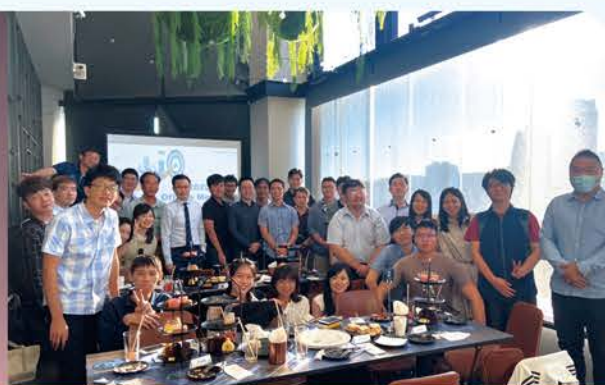
2020.06.15 Offsite meeting